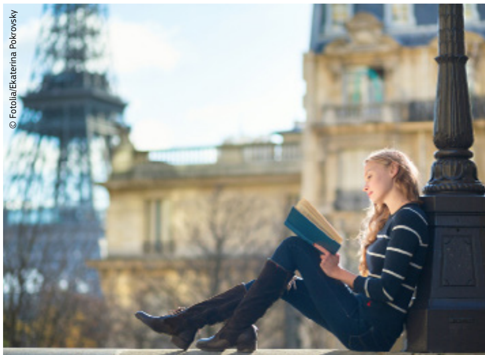
Zgjeroni horizontet tuaja; studjoni jashtë vendit.

Nxënësit e shkollave të larta në shkollat e trajnimit profesional, stazhistët dhe praktikantët mund të realizojnë një stazh ose trajnim jashtë vendit, ku nikoqir mund të jetë ndonjë kompani, vend pune (për shembull OJQ ose organizatë publike) ose shkollë profesionale, me një periudhë të mësimin në vend të punës në një kompani. Trajnimet mund të zgjasin nga 2 javë deri në 1 vjet.