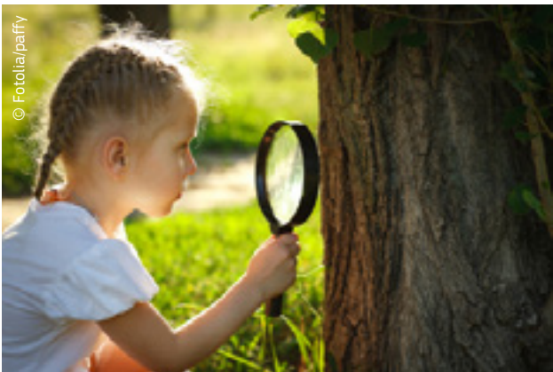
Të mësosh do të thotë të jetosh

Rrjedhimisht, BE-ja promovon një qasje të gjerë dhe gjithëpërfshirëse ndaj mësimit, e cila përfshin një varg metodash të ndryshme mësimore dhe mjedisë mësimore, për shembull mësimit joformal, jozyrtar dhe mësimit gjatë tërë jetës.