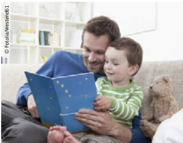
Subsidiariteti në praktikë: atë që e mësoni në shtëpi, nuk është e nevojshme ta mësoni në shkollë.