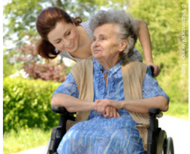
Mësimi i solidaritetit, mësimit për jetën.

Mësimi joformal nënkupton mësimit jashtë mjedisit zyrtar shkollor ose të trajnimit dhe bëhet me anë të aktiviteteve të organizuara që përfshijnë ndonjë formë të mbështetjes mësimore, për shembull: