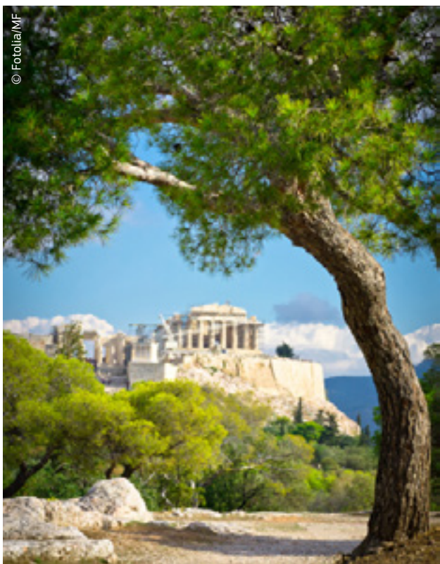
Arsimi ishte thelbësor për lulëzimin e qytetërimit klasik grek.

Për vendin tuaj: Në një botë që po bëhet gjithnjë e më e ndërvarur, ekonomitë nacionale do të arrijnë potencialin e vet të plotë, vetëm nëse mbështeten me sisteme të fuqishme të arsimit dhe trajnimit. Një vend që investon me mençuri në arsim dhe trajnim do të përparojë në biznes, shkencë dhe në art. Përveç kësaj, garantimi i mundësive arsimore për të gjithë do të ndihmojë në sigurimin e drejtësisë sociale dhe kohezionit social.