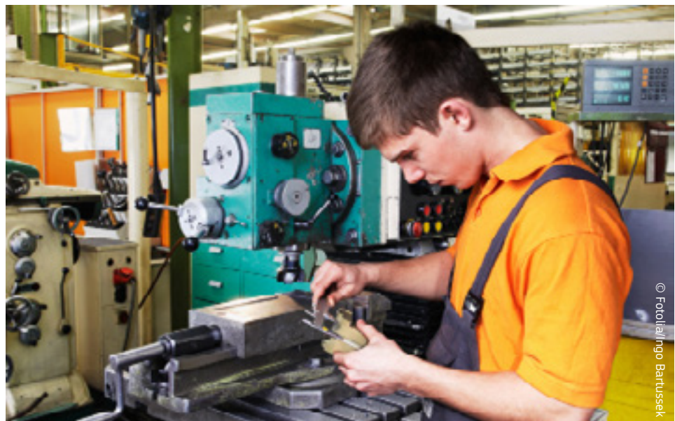
Prodhuesit janë duke luftuar për të gjetur punëtorë të kualifikuar

Projekti evropian HEAR ME ("më dëgjo" - shkurtesë nga - Pensionistët me arsim të lartë mentorojnë personat që braktisin shkollimin para kohe) ka punësuar pensionistë ose persona afër pensionimit dhe kanë dëshirë të punojnë me të rinj. Vullnetarët morën pjesë në disa kurse për aftësi të mentorimit. Pastaj pensionistët vepruan si mentorë, duke ofruar ndihmë dhe udhëzime për personat me nevoja të veçanta që braktisin shkollën para kohe, për të mbështetur qëllimet e tyre arsimore dhe të punësimit.